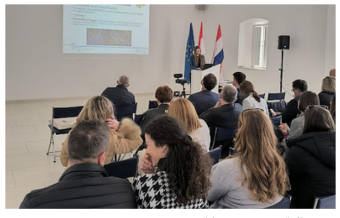
Fort Kaštio, Ston - 20. ožujka 2026.