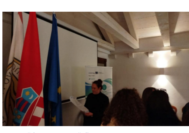
Fort Kaštio, Ston - 20. ožujka 2026.

Projekt BIOBASED nastavlja jačati prekograničnu suradnju i uključivanje dionika u jadranskom području kroz niz aktivnosti umrežavanja i zajedničkog stvaranja koje uključuju istraživače, MSP-ove, javna tijela i ključne aktere u sektorima akvakulture i plavog gospodarstva. Jedan od ključnih trenutaka bio je 2. Networking Event, održan 31. listopada 2025. u Foggii, na Odjelu D.A.F.N.E. Sveučilišta u Foggii, pod nazivom „Seaweeds and Side-Streams: From By-products to Value“.