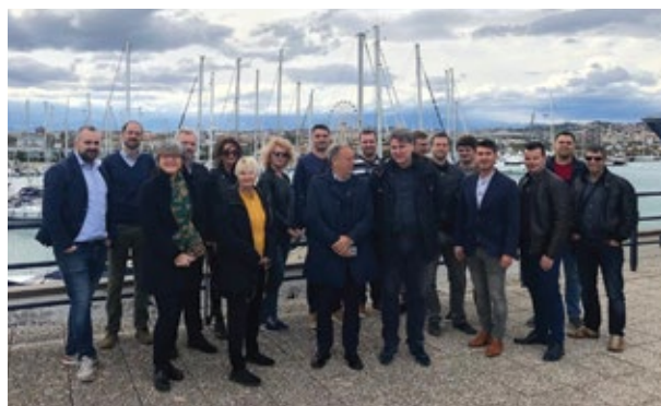
Sastanak Transnacionalnog Huba Coastenergy projekta, 6.-8.11.2019., Pescara, Italija