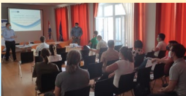
Hub plave energije Cresko-lošinjskog arhipelaga

Ključni dionici Hub-a su predstavnici gradova i općina, istraživačke institucije, lokalne udruge i institucije, poduzetnici, poglavito iz sektora hotelijerstva gdje postoje znatne potrebe za grijanjem i hlađenjem u priobalnoj zoni, zatim predstavnici lučkih uprava promatranog područja koji nam mogu dati informacije iz prve ruke vezano za legislativu za