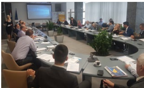
Sudjelovanje na konferenciji Arca 2019 Blue Green Hub Inovacijskoj konferenciji NOVE TEHNOLOGIJE U PLAVOM SEKTORU: Zelene inovacije u hrvatskoj brodogradnji, 17.10.2019., Ministarstvo gospodarstva i poduzetništva RH u Zagrebu