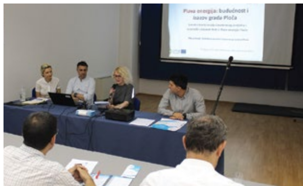
Prvi sastanak Huba plave energije Grada Ploča i 1. lokalna konferencija, 19.6.2019., Miniart dvorana, Športska dvorana u Pločama