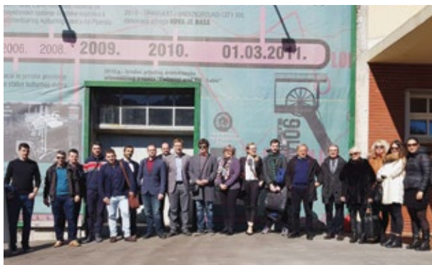
Kick-off meeting Coastenergy tima, Labin, 13.-14.3.2019.