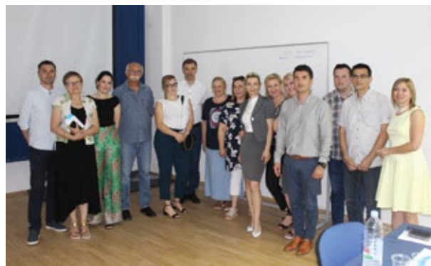
Članovi Huba plave energije Grada Ploča

Grad Ploče je 19. lipnja 2019. godine održao prvi sastanak Huba plave energije Grada Ploča u okviru prve lokalne konferencije Interreg Coastenergy projekta pod nazivom "Plava energija: budućnost i izazovi Grada Ploča". Ciljevi osnivanja Huba u Pločama su: 1) unaprijeđivanje komunikacije i prijenosa znanja među ključnim dionicima iz sektora plave energije u Pločama: javnih vlasti, znanstveno-istraživačkih institucija, tvrtki, udruženja i građana 2) izrada studije izvodljivosti za pilot projekt primjene dizalica topline u odabranom objektu u priobalju, kao rezultat procesa suradničkog kreiranja provedenog u okviru lokalnih radionica i 3) sudjelovanje u radu Transnacionalnog Coastenergy Huba Italija-Hrvatska kroz sveobuhvatno ispitivanje propisa, tehnologija, mogućnosti financiranja i prepreka u vezi razvoja postrojenja za plavu energiju u Jadranskoj regiji.